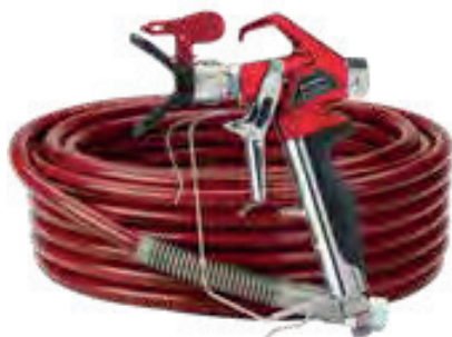
Flexible de 15 m et pistolet fournis