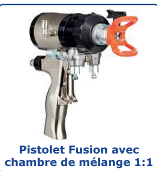
Pistolet Fusion avec chambre de mélange 1:1